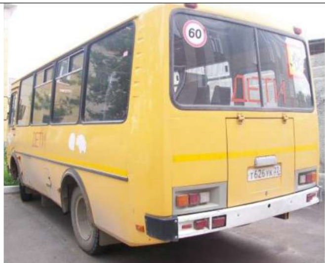
ПАЗ-32053, вид сзади слева