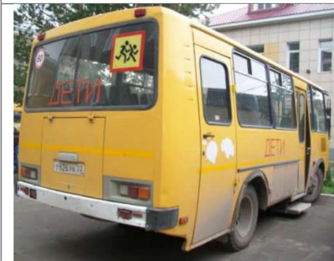
ПАЗ-32053, Вид сзади справа