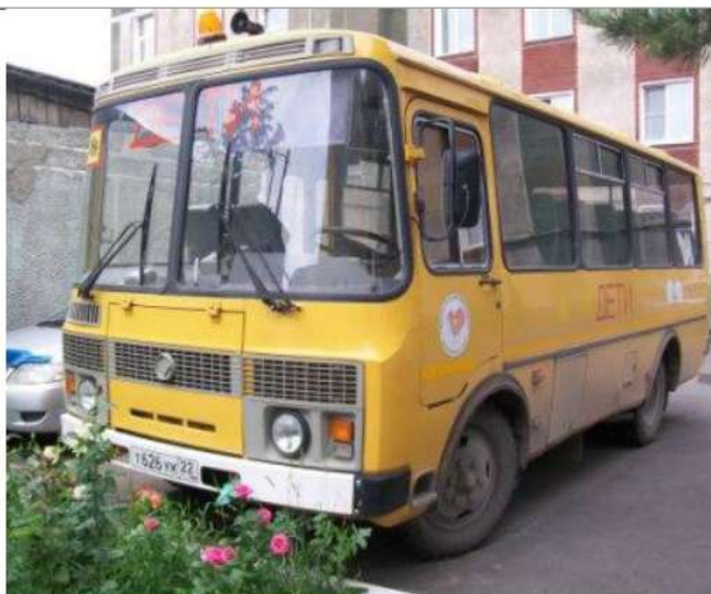
ПАЗ-32053, Вид спереди слева