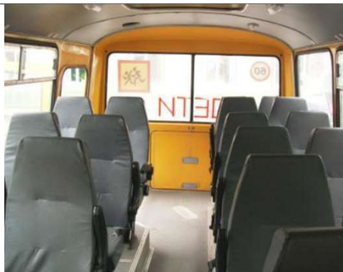
ПАЗ-32053, Состояние салона