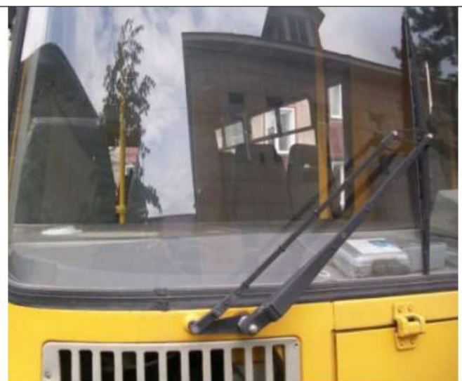
ПАЗ-32053, Трещина лобового стекла