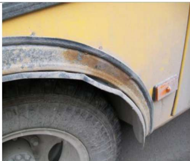
ПАЗ-32053, Коррозия крыльев