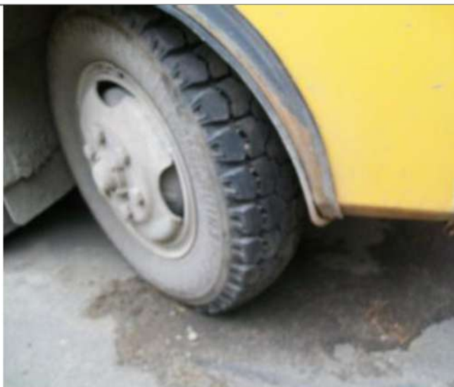
ПАЗ-32053, Состояние передних колёс