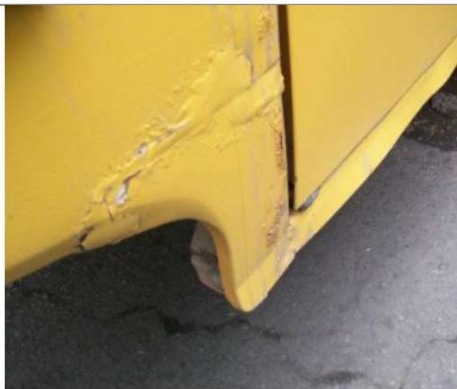
ПАЗ-32053, Состояние порогов