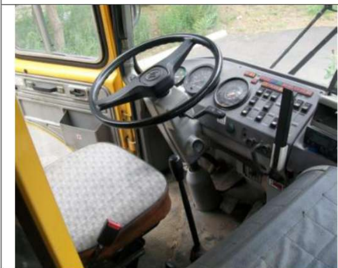
ПАЗ-32053, Панель приборов