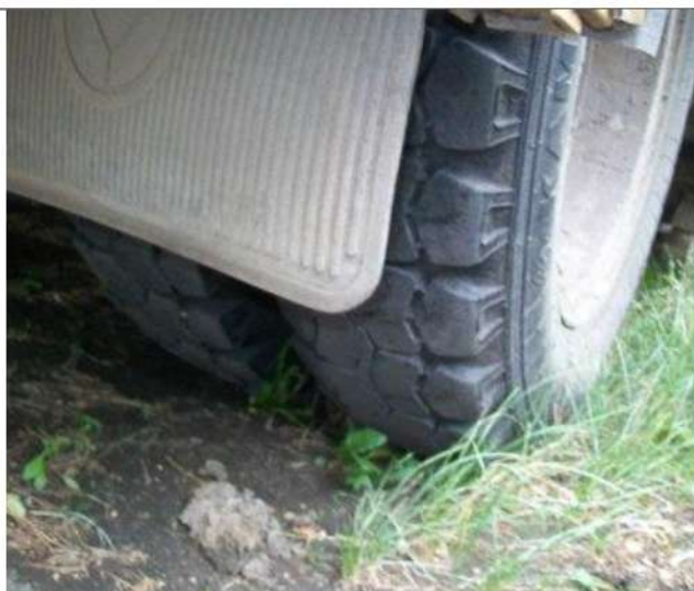
ПАЗ-32053, Состояние задних колёс