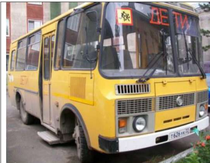
ПАЗ-32053, вид спереди справа