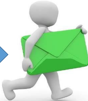
Уведомление о заинтересован- ности