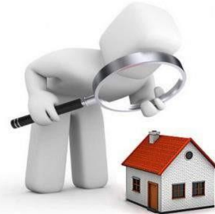
Орган управления или надзора