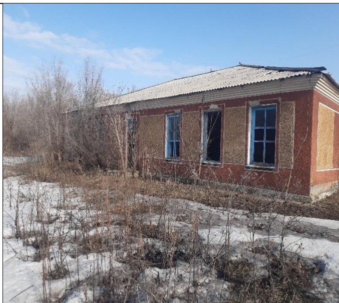
Здание по Луговой 42 в Буграх, Вид с юго-востока