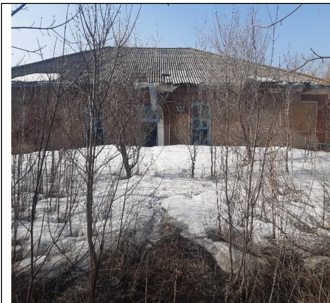
Здание по Луговой 42 в Буграх, Вид с запада