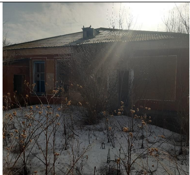
Здание по Луговой 42 в Буграх, Вид с юго-запада