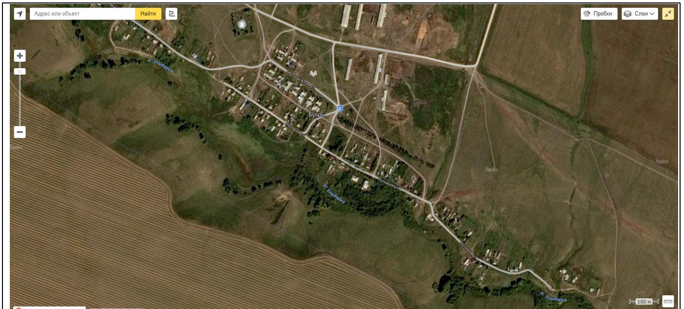
План посёлка Бугры на спутниковой карте Рубцовского района

Земельный участок имеет кадастровый номер 22:39:042101:92. Из инженерных коммуникаций на участке есть воздушная линия электропередач 220 В. Твёрдое покрытие на улице Луговой в данном районе отсутствует. Ограждение и кольцевой проезд отсутствуют.