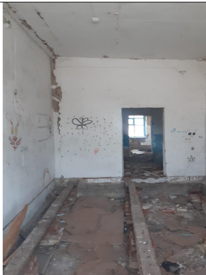
Здание по Луговой 42 в Буграх, Вид изнутри