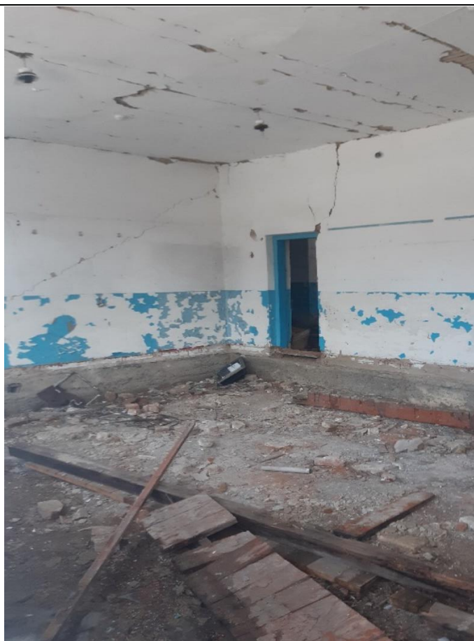
Здание по Луговой 42 в Буграх, Вид изнутри