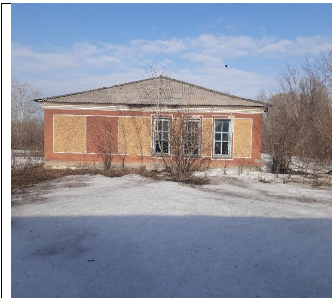
Здание по Луговой 42 в Буграх, Вид с востока