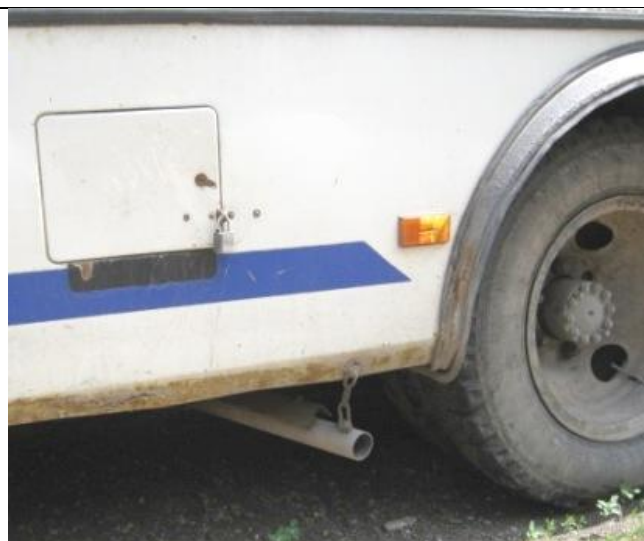
ПАЗ-32053, Состояние задних колёс