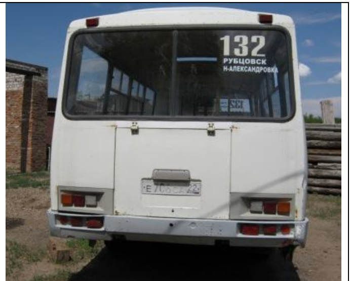
ПАЗ-32053, вид сзади