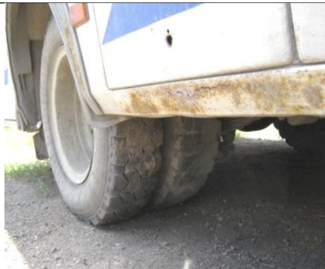
ПАЗ-32053, Состояние порогов