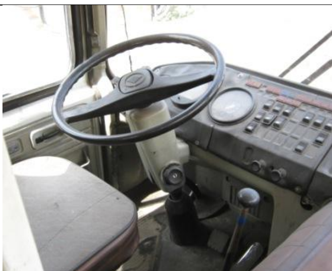
ПАЗ-32053, Панель приборов