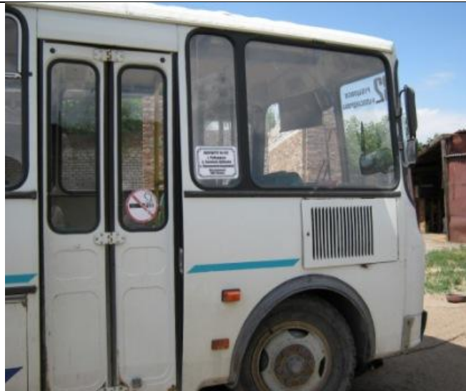
ПАЗ-32053, Вид справа