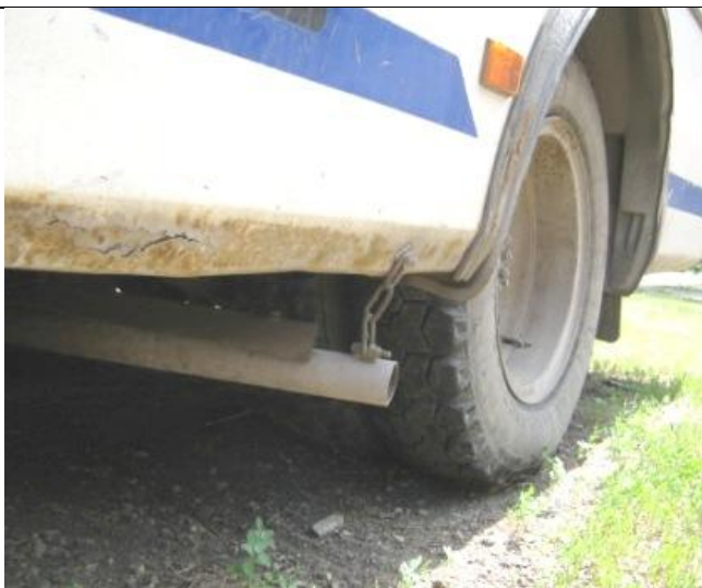
ПАЗ-32053, Коррозия крыльев и порогов