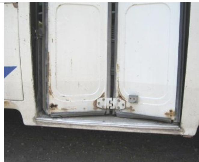
ПАЗ-32053, Дверь не закрывается до конца