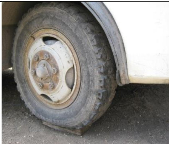
ПАЗ-32053, Состояние колёс