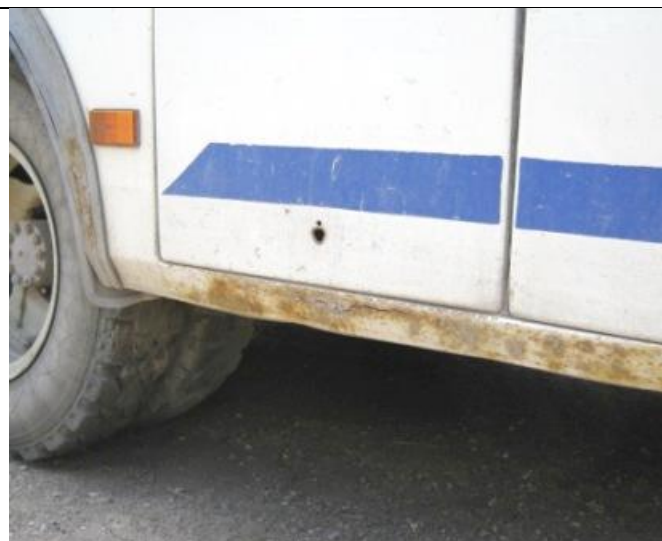
ПАЗ-32053, Коррозия порогов