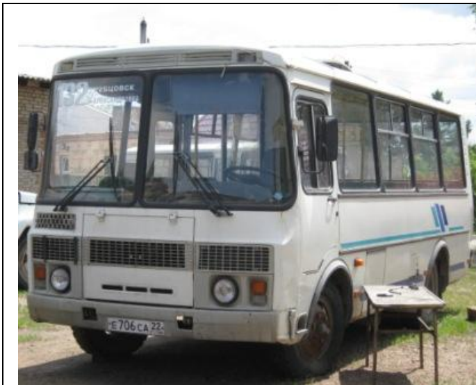
ПАЗ-32053, вид спереди