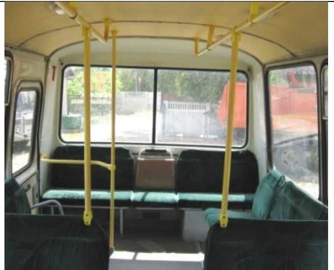
ПАЗ-32053, Состояние салона