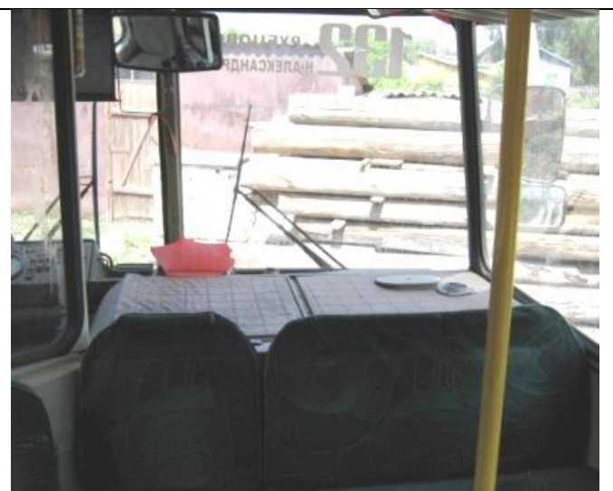
ПАЗ-32053, Состояние салона